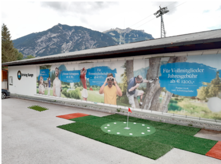
Bild 1: Eröffnung einer SHORT GOLF Insel GC Achensee am 29.5.2020

Golf4you hat in Zusammenarbeit mit Sportwissenschaftlern der Technischen Universität München ein Spielen auf Übungsanlagen entwickelt, das weitgehend die Werte des Spiels auf dem Platz beinhaltet, das Spielen auf einer SHORT GOLF Insel. Die SHORT GOLF Insel ist eine Kunstrasen Spielbahn für einen Annäherungsschlag und das Putten. Das sind die Schläge auf das und auf dem Grün.