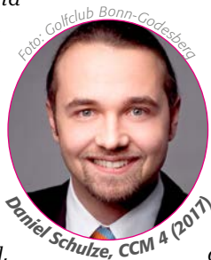
CCM 4 (2017)