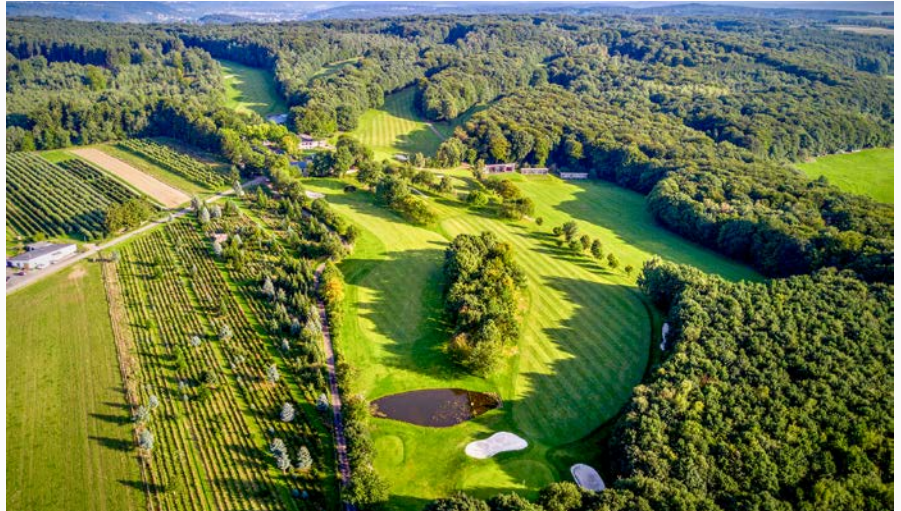
Der Golfclub Bonn-Godesberg in Wachtberg gilt als einer der schönsten Waldplätze Deutschlands.