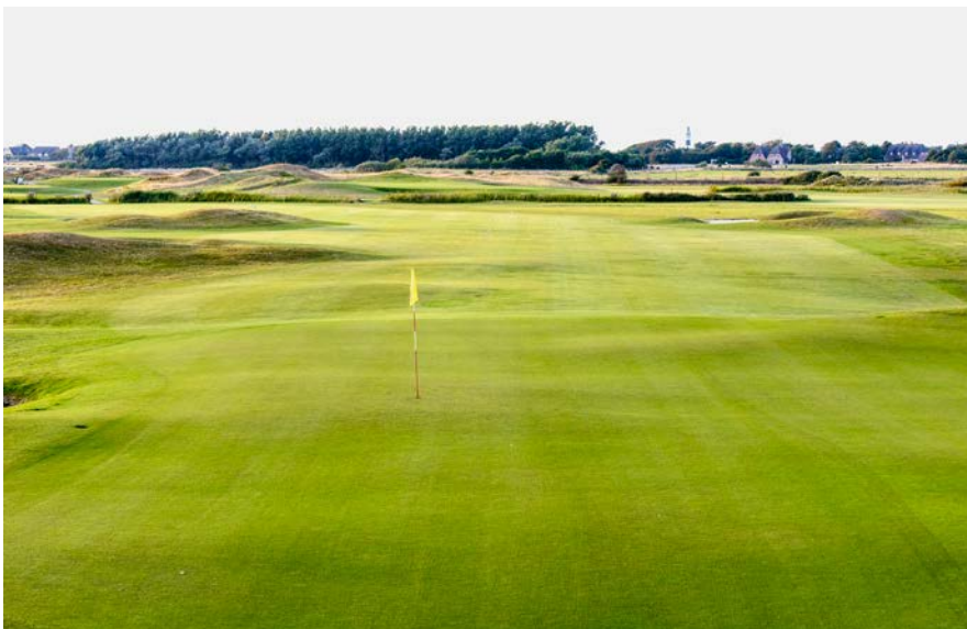
Der küstennahe Links Course des Marine-Golf-Clubs Sylt erstreckt sich auf einer Fläche von 80 Hektar neben dem Flughafen-Gelände vor den Toren Westerland.

Seit mehreren Jahren nimmt der Tourismus in Deutschland zu; 2016 im siebten Jahr in Folge. Einen Grund für den boomenden Deutschland-Urlaub sehen Experten in den vielen Krisenherden weltweit und den daraus resultierenden zunehmenden Sicherheitsbedenken. Besonders inländische Gäste kurbeln das Wachstum an, denn dem Statistischen Bundesamt in Wies-