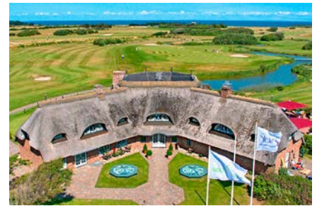
Das 2008 errichtete Clubhaus des Marine-Golf-Clubs Sylt ist als prägnantes Achteck in Holzbauweise gestaltet.

Der Tourismus spielt auf Sylt in allen Bereichen eine große Rolle, so auch im Marine-Golf-Club Sylt. Kein