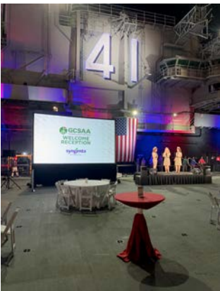
Abb. 7: GCSAA-Eröffnungsveranstaltung auf dem Landedeck der USS Midway

Am Montagabend fand auf der USS Midway die GCSAA-Eröffnungsveranstaltung statt (Abbildungen 5 und 6). Der Flugzeugträger wurde 1945 gebaut und liegt schon seit 2004 in San Diego vor Anker. Inzwischen werden dort Führungen und Veran-