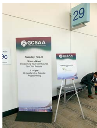
Abb. 8: Der schlichte Eingang zum Seminarraum, ...

staltungen durchgeführt. Es war sehr interessant, dort die Führungen unter Deck und die Flüge in den Flugsimulatoren mitzerleben. Die Welcome-Rezeption-Veranstaltung wurde mit ca. 1.000 Teilnehmern im Freien auf dem Start- und Landedeck durchgeführt (Abbildung 7).