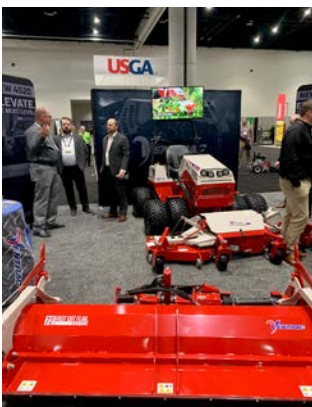
Abb. 17: Maschinen von Ventrac werden künftig über Toro vertrieben.