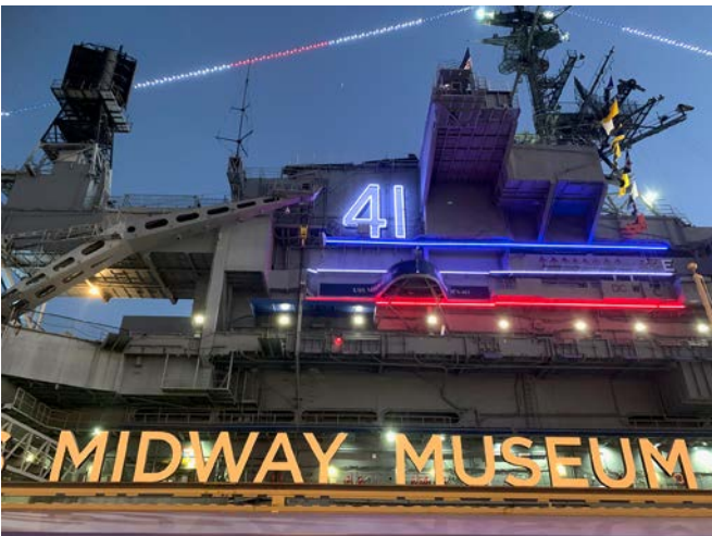
Abb. 6: ... einem seit 2004 vor Anker liegenden Flugzeugträger statt.