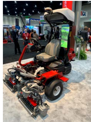
Abb. 14: Toro Grünsmäher eTRIFLEX 3360