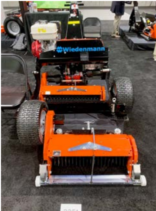
Abb. 12: Der handgeführte Wiedenmann STrac 700