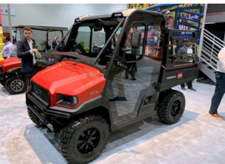
Abb. 16: Toro UTX Workman