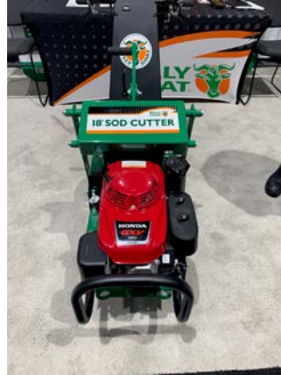
Abb. 13: Sodenschneider von Billy Goat