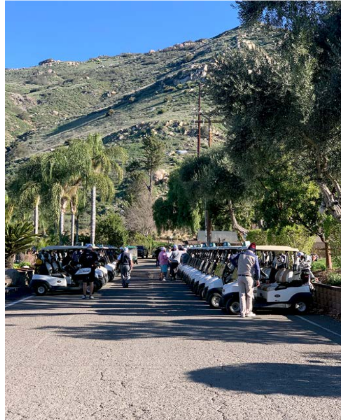
Abb. 2: Die Topografie im Hintergrund verdeutlicht die Namensgebung: Singing Hills Golfresort

Von Samstag bis Dienstag wurden die 2022 Golf Championships durchgeführt. Die knapp 400 Teilnehmer spielten Samstag den 05.02. und Sonntag den 06.02. auf dem Torrey Pines South, Torrey Pines North (Abbildung 1) und dem Golfresort Singing Hills (Abbildung 2) das 4-Ball und das Texas Scramble-Turnier. Ich selbst spielte am Samstag in Singing Hills und Sonntag auf dem Torrey Pine North mit (Abbildungen 3 und 4).