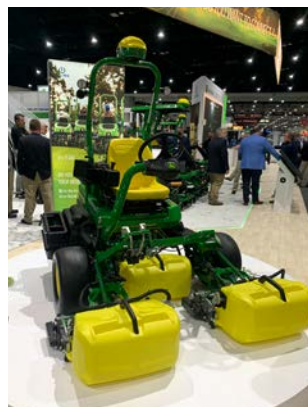
Abb. 18: John Deere-Grünsmäher mit dem Interaktive Precision Cut System