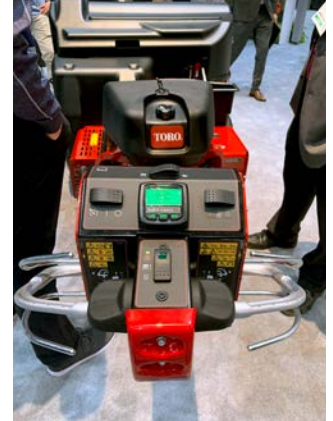
Abb. 15: Toro Procore 648s

Einheiten (Bodenfräse, Aerifizierer, Nachsaat-, Spiker- oder Vertikutierereinheit u.a.) sehr schnell ausgewechselt werden können (Abbildung 12).