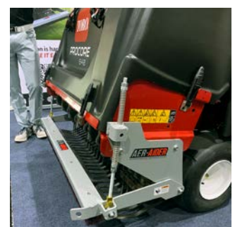
Abb. 11: Anbaubürste von Aer-Aider