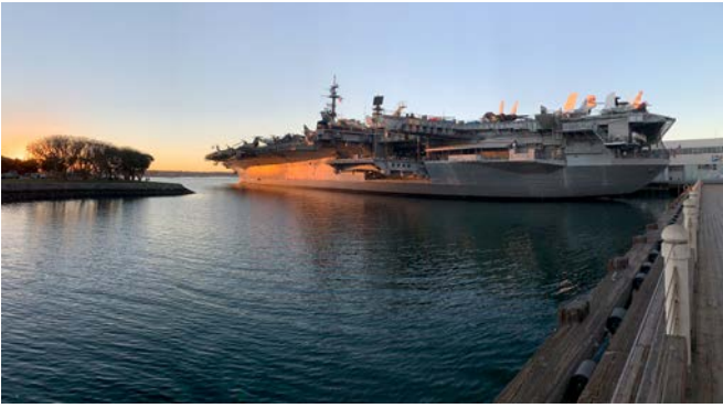
Abb. 5: Typisch amerikanisch: „Think big“: Die GCSAA-Eröffnungsveranstaltung fand auf der USS Midway, ...