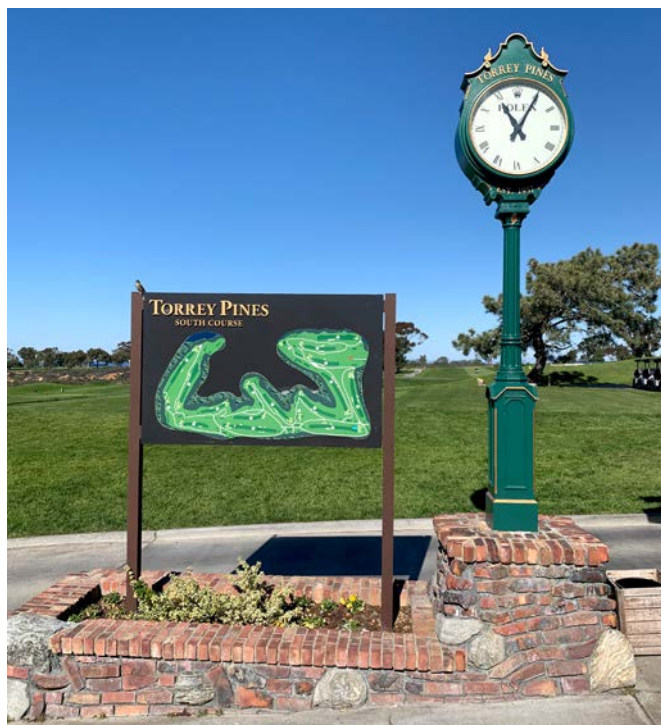
Abb. 1: Stilvoll ging es auf die Runde: Thorey Pines South Course

Das Golfspiel auf dem Nord-Platz von Thorey Pines, mit Blick auf den Pazifischen Ozean, auf der eine Woche vorher noch die Farmers Insurance von der PGA durchgeführt wurde, war ein tolles Erlebnis für mich. Auf Grüns mit einer Ballrolllänge von 13 Fuß und 7 cm hohem Semirough war es schon eine spielerische Herausforderung, aber mit einem geteilten zweiten Platz waren wir Vier am Ende doch sehr zufrieden.