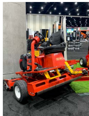
Abb. 19: Greensroller von Tru Turf