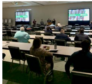
Abb. 9: ... der hier noch etwas leer wirkt – die Vorträge selbst waren nahezu ausgebucht.

Am Dienstag besuchte ich im Convention Center 2 Seminare (Abbildungen 8 und 9). Trotz der wenigen Gäste waren die Kurse, die von Montag bis Donnerstag angeboten wurden, fast komplett ausgebucht. Es wurden in diesem Jahr insgesamt 3.700 Seminarplätze gebucht.