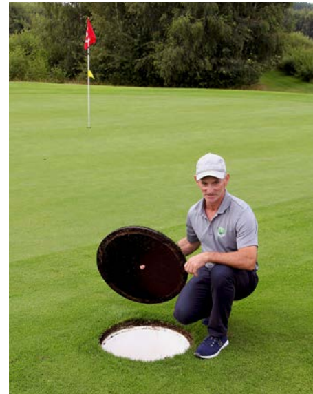
Insgesamt 36 Löcher Footgolf sind in Deinste in den regulären 18-Löcher-Platz integriert.

platz integrierte Projekt „Footgolf“. Derzeit sind bei je 9 Löchern 18 Löcher Footgolf fest eingebunden, also insgesamt 36, sechs zusätzliche gibt es auf dem Übungsareal. „Etwas Widerstand seitens der Golfer gab und gibt es schon“, bemerkt Steffens, „wir haben uns dennoch dazu entschlossen, um insbesondere Fußballvereine auf unseren schönen Platz zu bekommen und die Hemmschwelle vor Golf zu senken. Und, 5% Wandlungsquote 2020 bei 300 Runden Footgolf geben uns Recht – 2021 waren es bislang (Anm. d. Red.: Anfang August 2021) übrigens schon 450 Runden!“ Footgolf wird dabei mit regulären Fußbällen gespielt, zur Schonung des Geländes sieht das Regelwerk vor, dass entweder Schuhe mit Multinockensole sowie Schuhe für Turn- oder Hallenböden erlaubt sind. Stollenschuhe sind ausdrücklich nicht gestattet. In der Praxis werden ab 20 Interessenten neun Golf-Löcher für 18 Löcher Footgolf gesperrt, das Greenkeeping steckt die Fahnen um und dann geht es los.