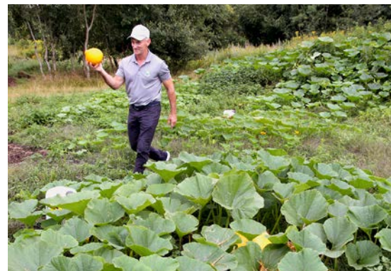
„Geheime“ Kürbisproduktion auf dem Golfplatz: Mit einem Bekannten läuft derzeit eine Wette um den größten Kürbis – der leicht verdeckte vorne könnte es sein!