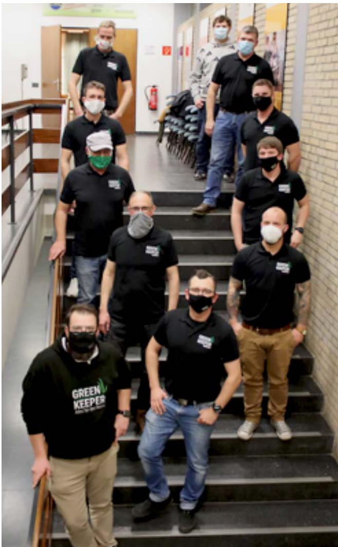
„Eingeschworene Greenkeeper-Gemeinschaft“ in Corona-Zeiten

Bei der praktischen Abschlussprüfung handelt es sich um eine projektbezogene Prüfung, in der dem